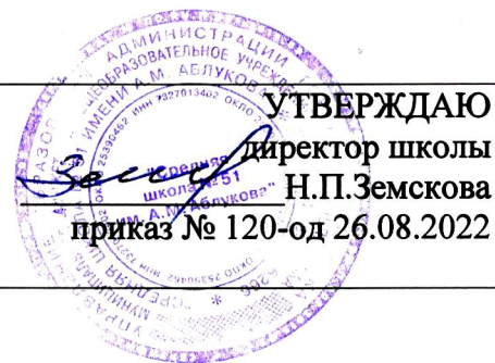
ГРАФИК РАБОТЫ ЦЕНТРА ЗДОРОВОГО ПИТАНИЯ

СОГЛАСОВАНО педагогический совет протокол №08 от 26.08.2022